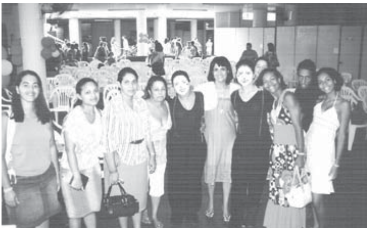
Conselheiras e supervisoras se renderam à alegria da oficina de teatro