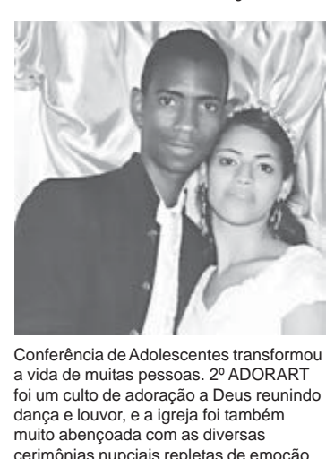
Conferência de Adolescentes transformou a vida de muitas pessoas. 2º ADORART foi um culto de adoração a Deus reunindo dança e louvor, e a igreja foi também muito abençoada com as diversas cerimônias nupciais repletas de emoção

“A gratidão não precisa estar vinculada aos nossos sentimentos” .