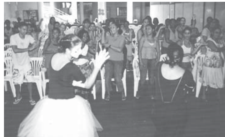
Teatro foi uma das três oficinas realizadas no TRELIC, em Niterói