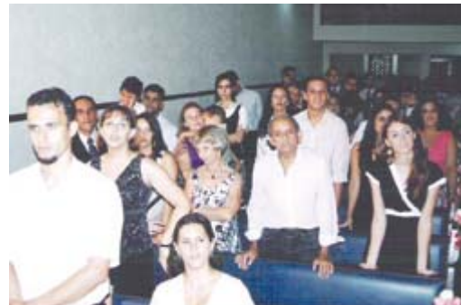
Parentes, amigos e diversos líderes prestigiaram a cerimônia