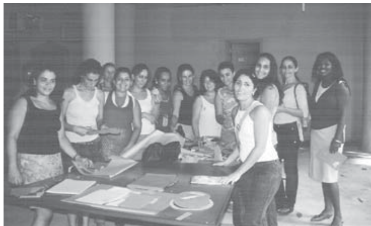
Dividido em grupos, o TRELIC realizou oficinas após a palestra da manhã